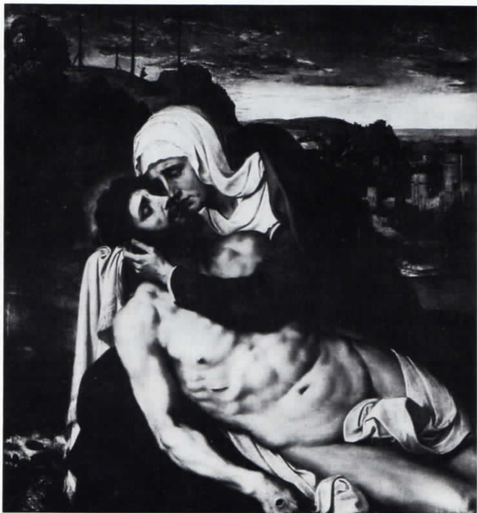
Willem Key: Beweinung Christi. Öl auf Holz, 112 x 103 cm, Bayerische Staatsgemäldesammlungen, München, Inv. Nr. 539. Weil die Kopie in Berg- kirchen stark beschädigt ist und der Restaurierung harret, sei hier das Original gebracht.