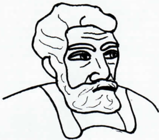
Das Porträt des Barons Théodul François d'Iselin de Lanan nach der Abbildung auf dem Grabstein im St.-Georgs-Friedhof zu Freising.

König den Orden des hl. Ludwig, jenes Kreuz, das die Adler auf dem Freisinger Wappenstein in ihren Fängen halten.