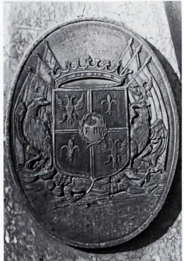
Wappenbild mit Allegorien auf dem Grabmal des Barons im St.-Georgs-Friedhof zu Freising (Kapellenwand).