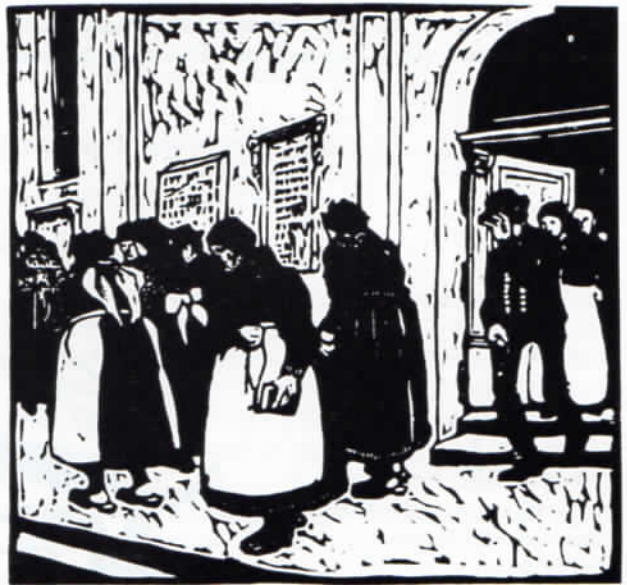
Abb. 2a und 2b: Walther Klemm: Viehmarkt in Dachau und Frauen vor der Kirche. Schwarzweiß-Holzschnitte.