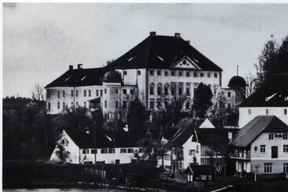
Abb. 2: Schloß Odelzhausen 1720–1936.

Die erste Frage gilt der Datierung des Umbaus und dem Versuch, aus alten Ansichten des Schlosses hierfür An-