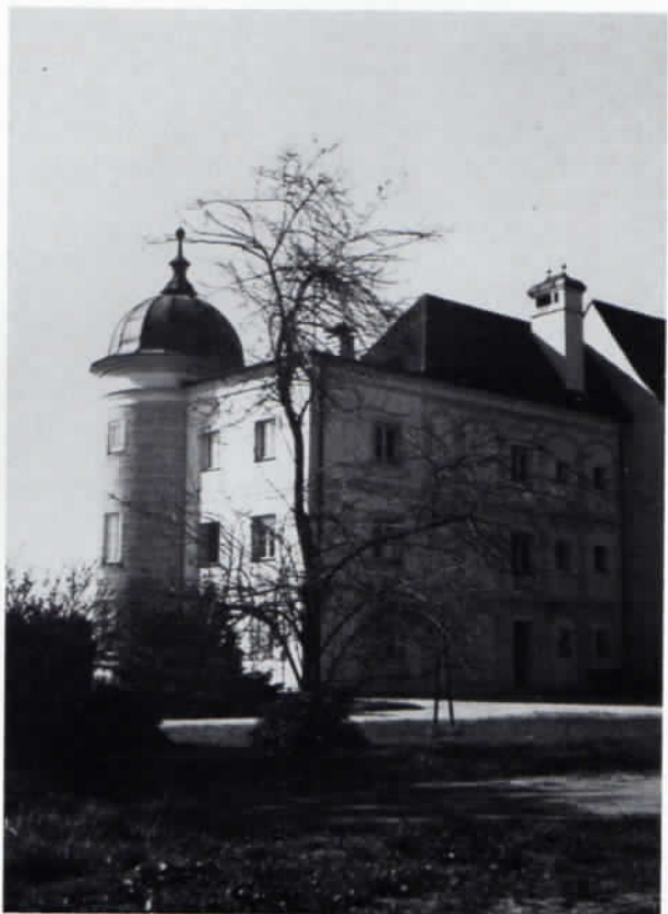
Abb. 5: Schlosshotel Odelzhausen erbaut 1966.