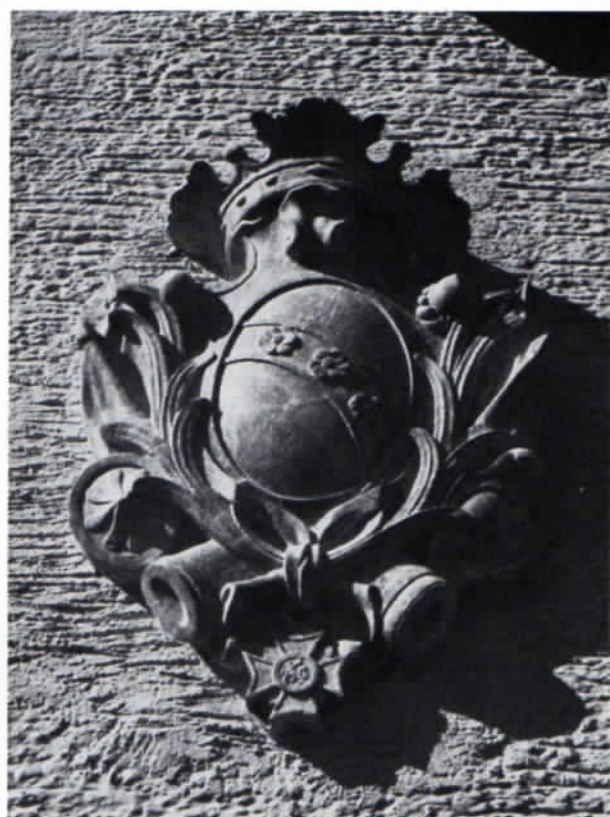
Abb. 4: Das Wappen der Grafen von Minucci. Wappenstein in Odelzhausen.