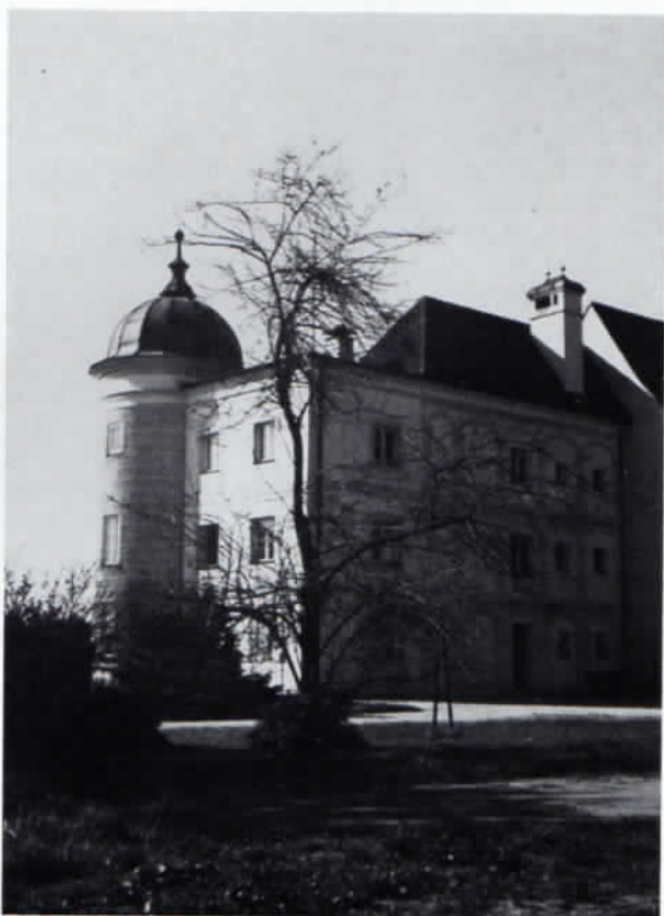
Abb. 5: Schlosshotel Odelzhausen erbaut 1966.