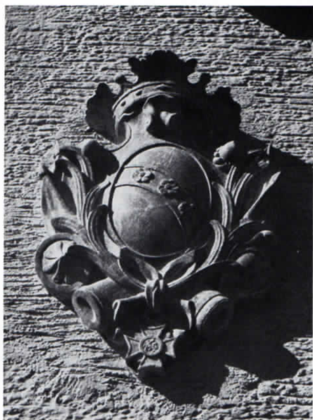
Abb. 4: Das Wappen der Grafen von Minucci. Wappenstein in Odelzhausen.