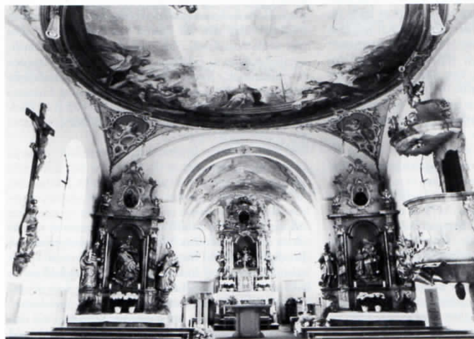
Inneres der Pfarrkirche zu Kleinberghofen.

Armuth und Abgang einer Arbeith in Gefahr Laufe, all das meinige, so Wenig dies seih, Verkaufen zu müssen um nur meine Kost- und HausHerrn befriedigen zu können.« Bis zum Dezember 1773 wurden insgesamt fünf Briefe zwischen Augsburg (dem Wohnsitz Dieffenbrunners), Kleinberghofen und Freising gewechselt. Wichtig für eine genaue Datierung der Deckengemälde ist aber nun ein Antwortschreiben Widemanns vom 3. Dezember 1773 nach Freising. Demzufolge fand die Chorausmalung gemäß dem »Vorzeig« (d. h. gemäß einem dem Fresko entsprechenden Entwurf) und nachdem der Maler die Farben und nötigen Geräte selbst beschafft hatte 14 bereits 1764 »post festum S. Augustini« (d. h. nach dem 28. August) statt und dauerte sechs bis sieben Wochen, also bis zum Beginn der kalten Jahreszeit, in der es dem