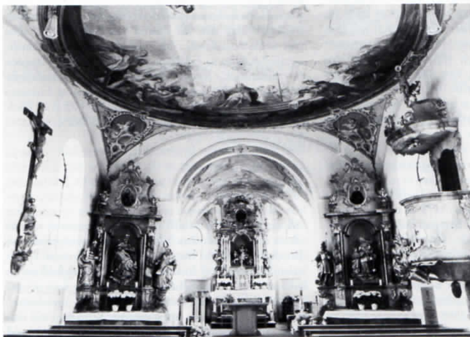
Inneres der Pfarrkirche zu Kleinberghofen.