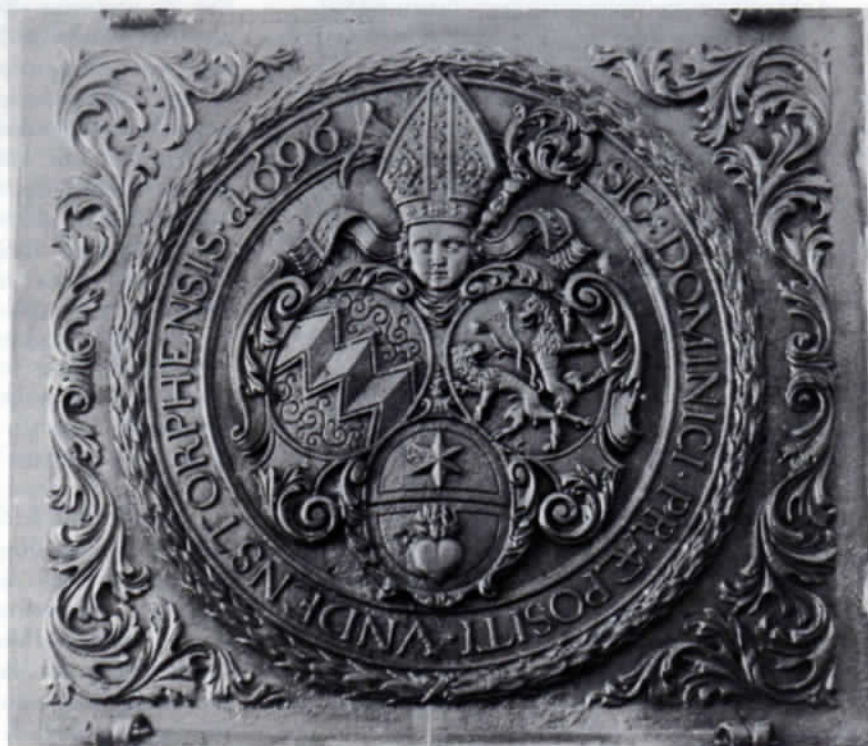
Ofenplatte aus dem Jahre 1696 mit dem Wappen des Indersdorfer Propstes Dominikus Vent.

zusammen mit den Urkunden in den Tresoren der Archive eingeschlossen sind. So ist die Stimme eines Historikers, der schon lange auf ihre Schönheit hingewiesen hat, recht allein geblieben, die des Archivdirektors Dr. Edgar