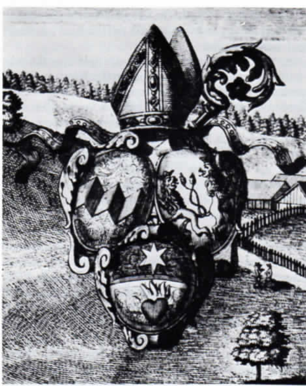
Wappen des Indersdorfer Propstes Dominikus Vent auf dem Weningstich des Klosters Indersdorf.

gesamte Heraldik des Siegels der Tradition unterstellt, der sich sein Träger verpflichtet weiß.