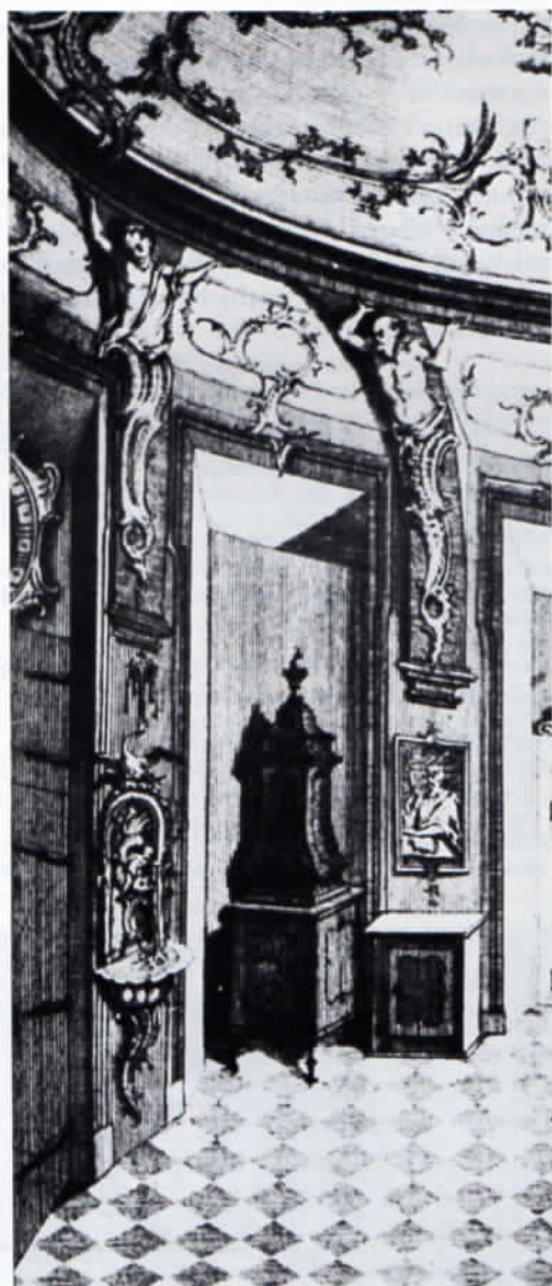
Kupferstich mit Darstellung des Barockofens.

Wer heute die Eingangshalle zum Kloster Indersdorf betritt, erblickt – wenn sich sein Auge an das Dämmerlicht gewöhnt hat – an der Wand eine mit starken Klammern befestigte Eisenplatte. Sie hat das Siegel eines Propstes zum Gegenstand, das sich in einem runden Blät-