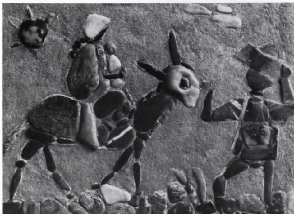
Abb. 7: Wilhelm Deninghoff: Flucht nach Ägypten. Mosaik, 1970.

auch hier einmal ein Kunsthistoriker ein Oeuvre aufstellt. Bei Hed Prévot erfahren wir übrigens die erstaunliche Tatsache, daß Deninghoff nicht nur Steine aus dem Ampertal und aus Solnhofen verwendete, sondern, daß