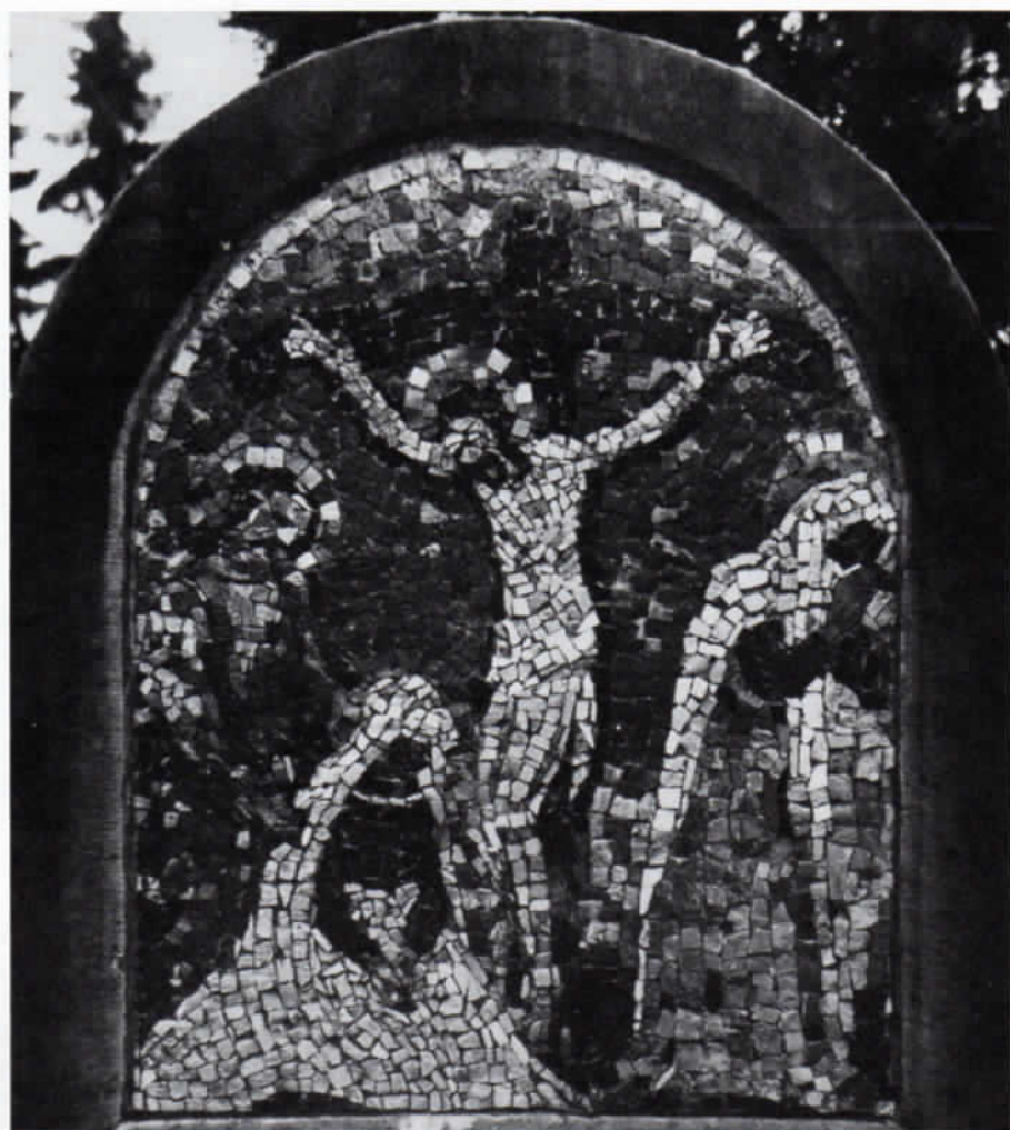
Abb. 6: Wilhelm Deninghoff: Kreuzigung. Mosaik für Grabmal in Ostbevern bei Münster/Westfalen, 1955.

namentlich in den neuen Schulbauten der letzten Jahre. Aber der jeweilige Umfang dieser Arbeiten, ihre Reihenfolge und die darstellungsmäßige Entwicklung ist noch völlig unbekannt und wieder müssen wir hoffen, daß