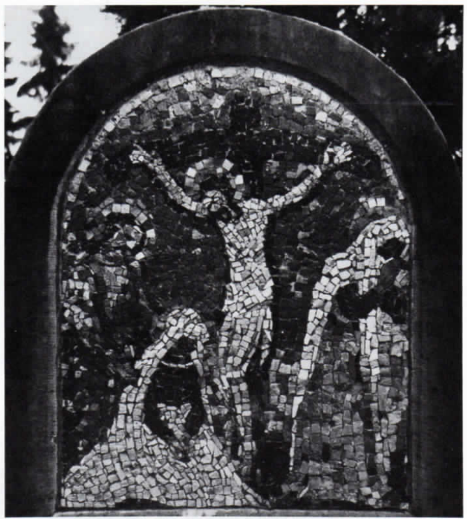
Abb. 6: Wilhelm Deninghoff: Kreuzigung. Mosaik für Grabmal in Ostbevern bei Münster/Westfalen, 1955.

namentlich in den neuen Schulbauten der letzten Jahre. Aber der jeweilige Umfang dieser Arbeiten, ihre Reihenfolge und die darstellungsmäßige Entwicklung ist noch völlig unbekannt und wieder müssen wir hoffen, daß