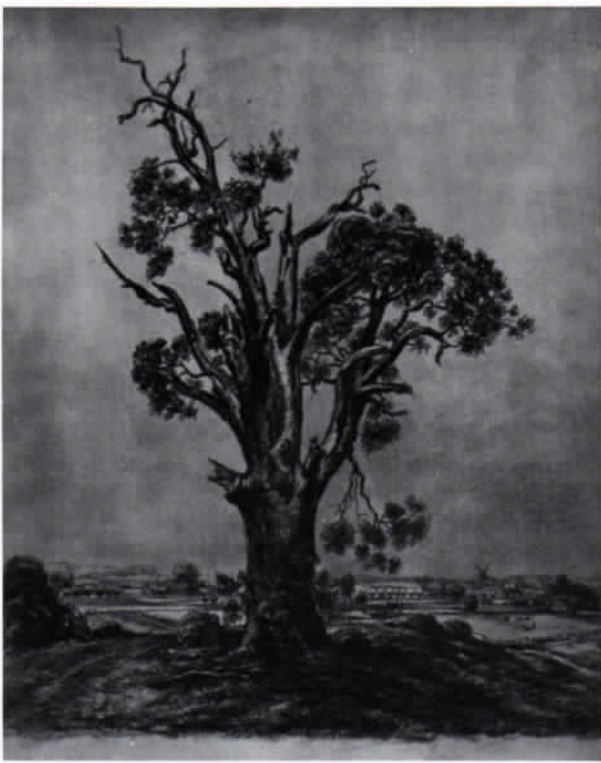
Abb. 2: Wilhelm Dieninghoff: Alte Eiche in Westfalen. Kreidezeichnung, 1950.

schiedener Verwendung hinter der Front zunächst in Rußland, dann in Frankreich eingesetzt. Dort geriet er in Kriegsgefangenschaft, aus der er 1945 nach München zu seiner Frau zurückkehrte.