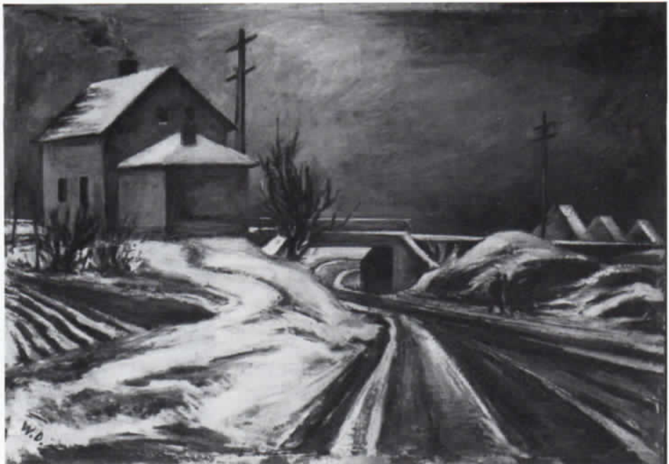
Abb. 3: Wilhelm Dieninghoff: Dachau, Unterführung der Münchener Straße. Öl auf Leinwand, 1972.

Konnten wir uns verhältnismäßig leicht über Dieninghoffs Lebensweg unterrichten, so stehen wir seinem Werk gegenüber vor großen Schwierigkeiten. Was hat er eigentlich alles vollbracht und wo liegen die Schwerpunkte seines Schaffens? Diese herauszufinden ist nicht