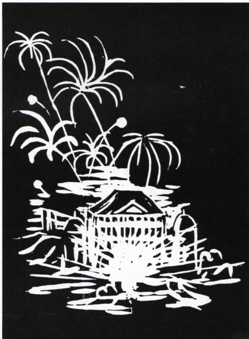
Dr. Peter Dörner: Feuerwerk in Odelzhausen 1814. Linolschnitt.

Der Tag beginnt mit einem Rundgang durch Schloß, Ökonomie und Brauerei – gleichsam als sichtbare Inbe-