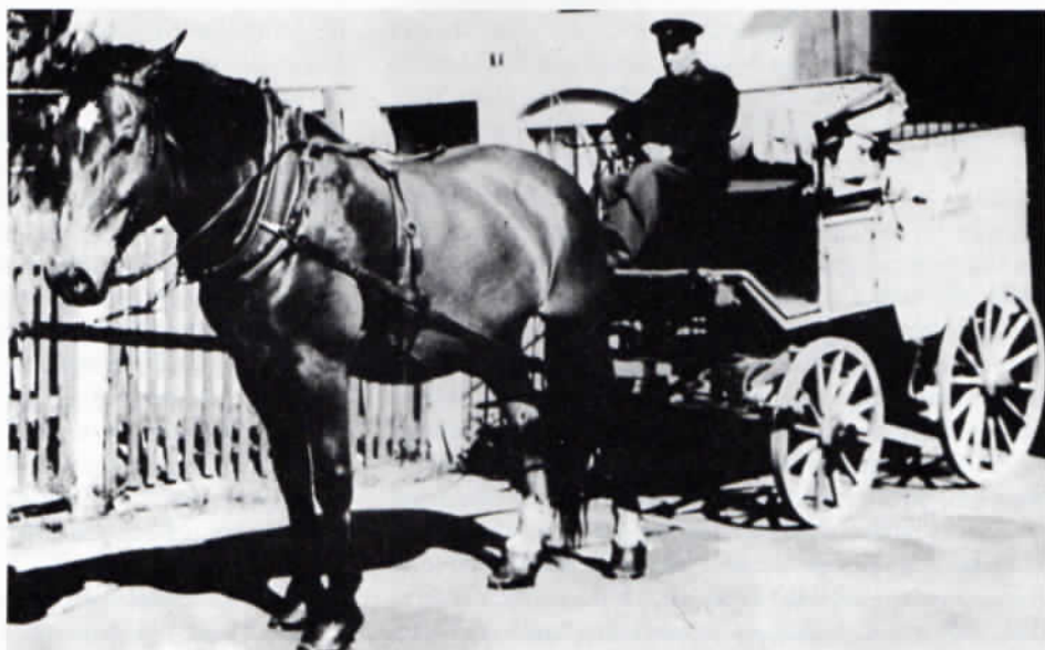
Postfuhrhalter (zugleich letzter Postillion) Rudolf Aumüller (geb. 1915) in Kloster Indersdorf, auf dem Landpostwagen.