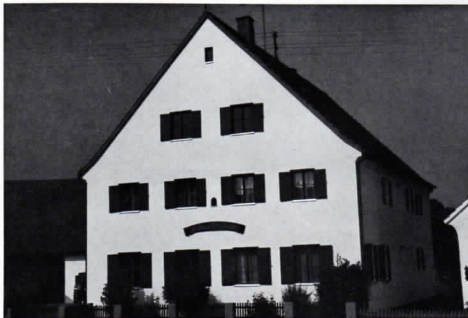
Der ehemalige Moserbauernhof, Dünzelbach Nr. 38; heute Ökonomie und Gasthaus Winterholler.