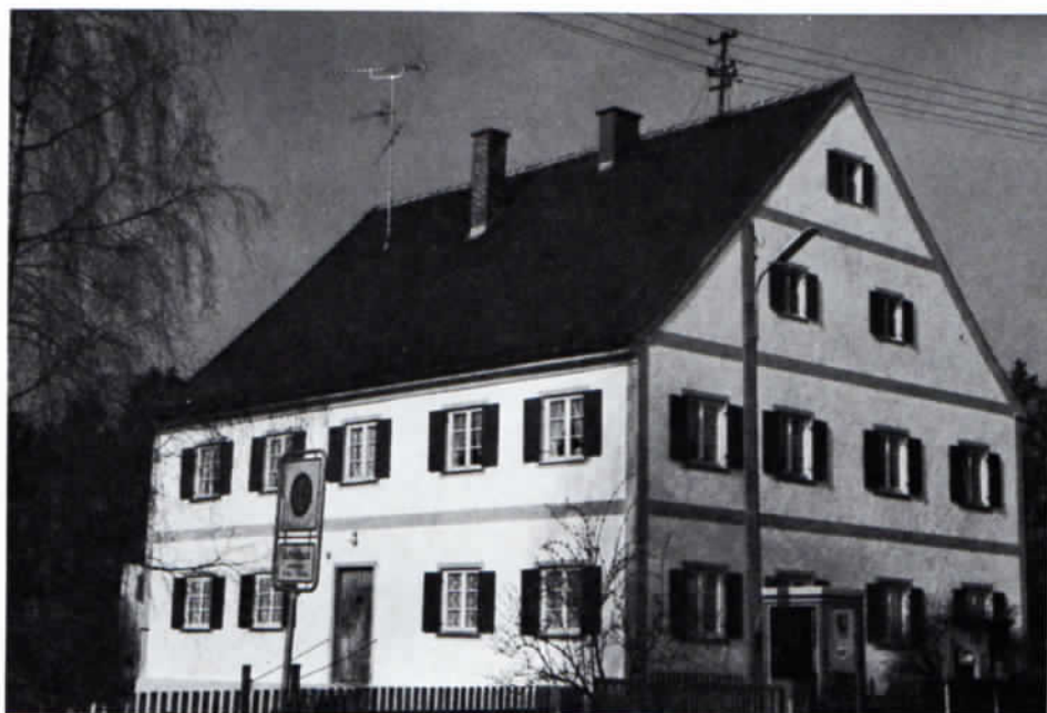
Der 1822 erbaute Dünzelbacher Pfarrhof.