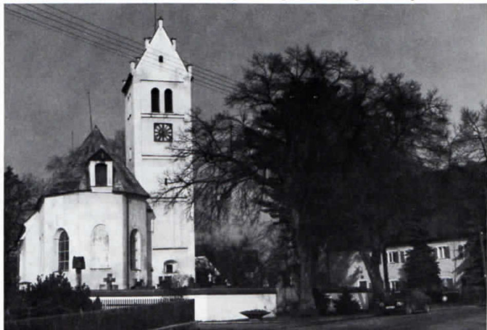
Die zwischen 1440 und 1500 erbaute Pfarrkirche in Dünzelbach. Rechts, leicht verdeckt das Gräfl. v. Törring'sche Forstant.