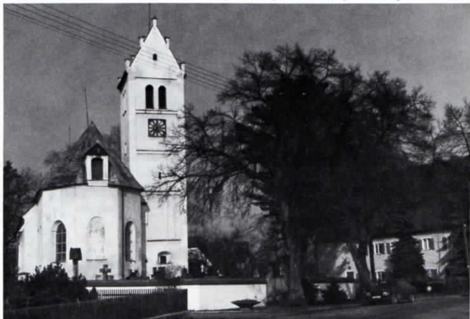
Die zwischen 1440 und 1500 erbaute Pfarrkirche in Dünzelbach. Rechts, leicht verdeckt das Gräfl. v. Törring'sche Forstamt.