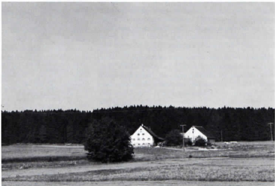
Abseits des Dorfes Dünzelbach liegt die einstige Mahlmühle (Ruile), Haus Nr. 66.