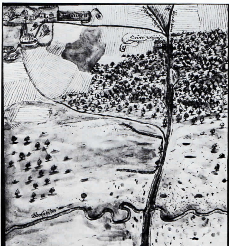
Straßenkarte vom Jahre 1766 mit dem Zollhaus (die erwähnten drei Kreuze sind eingezeichnet).

Dem Grafen wurde auferlegt, auf seine Kosten für den