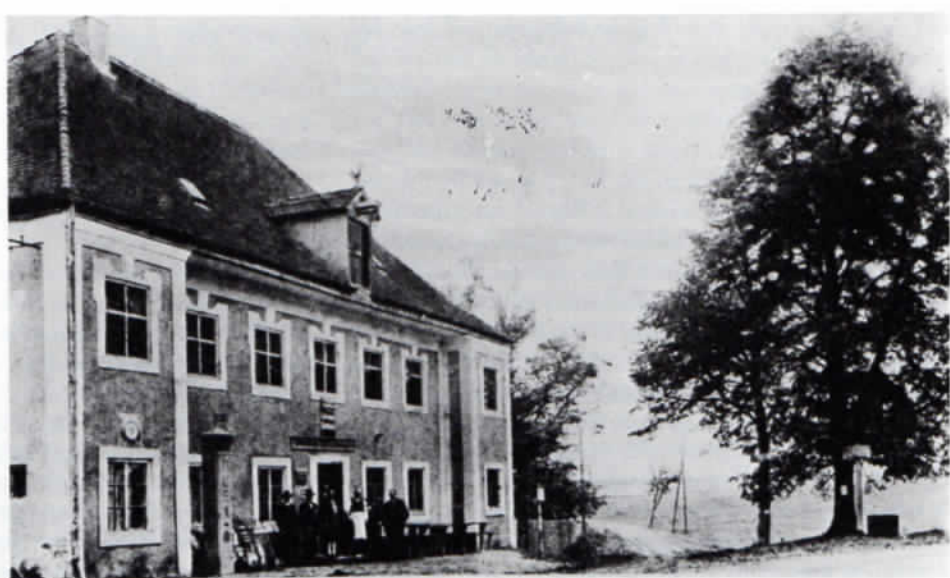
»Gasthof zum Göthewirt«, Maisteig, zwischen den beiden Weltkriegen. Im Jahre 1972 abgebrochen.