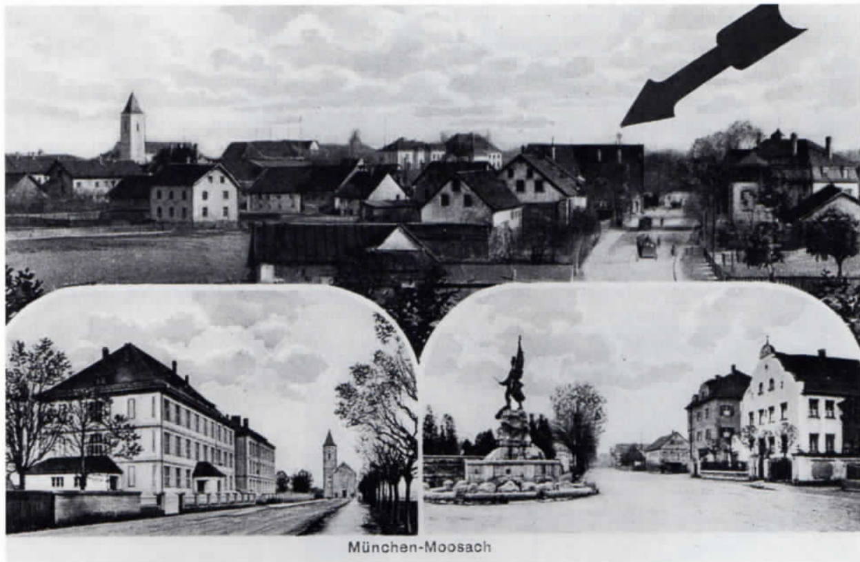
Postkarte von Moosach aus den 1930er Jahren. Der Pfeil weist auf den »Alten Wirt«.