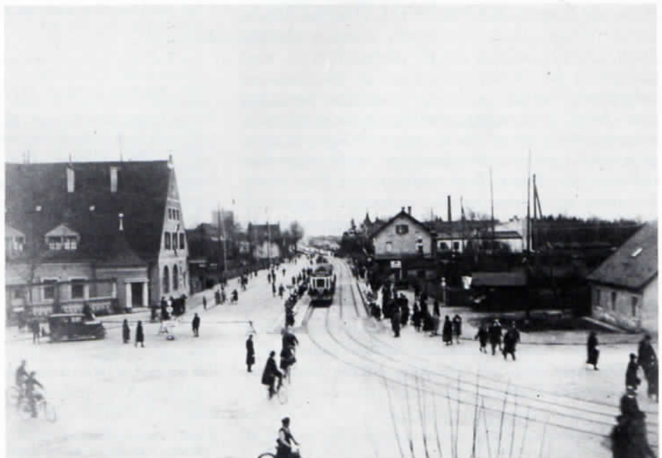
Straßenbahn nach Moosach, Kreuzung Dachauer Straße/ Pelkovenstraße/Pasinger Straße im Jahre 1930. Links der »Alte Wirt«.