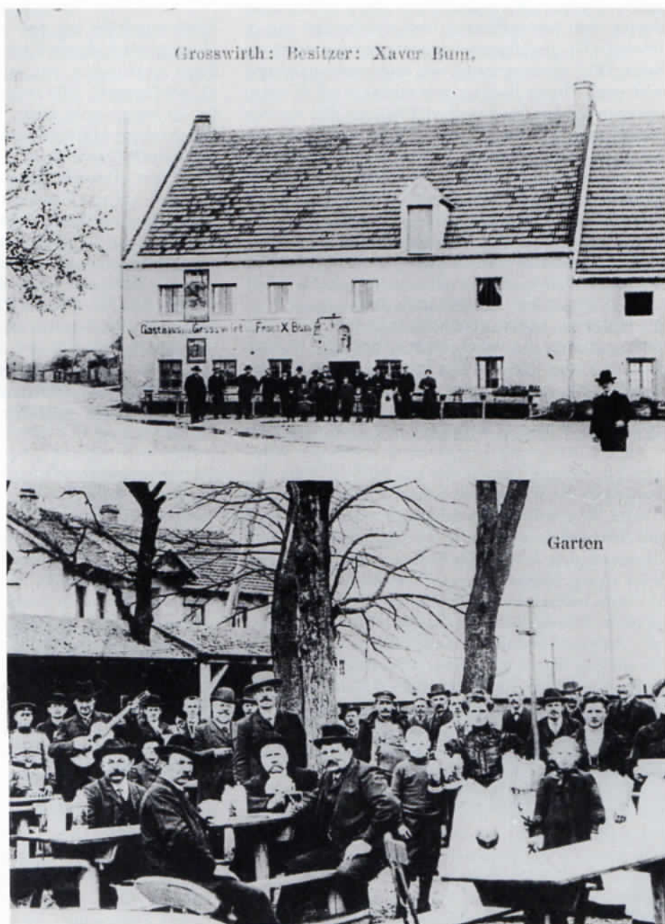
Moosach, Alter Wirt an der Dachauer Straße um 1900. Die Landstraße durchschneidet das Wirtsanwesen. Gegenüber lag der Wirtsgarten mit Kegelbahn.