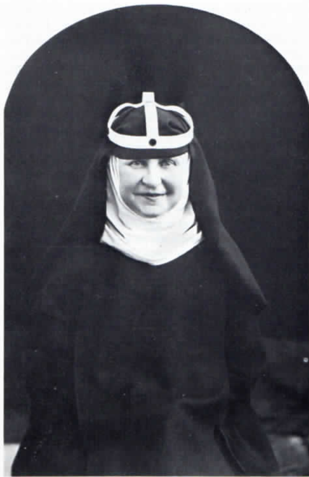
Birgittenmonche in alter Ordenstracht.