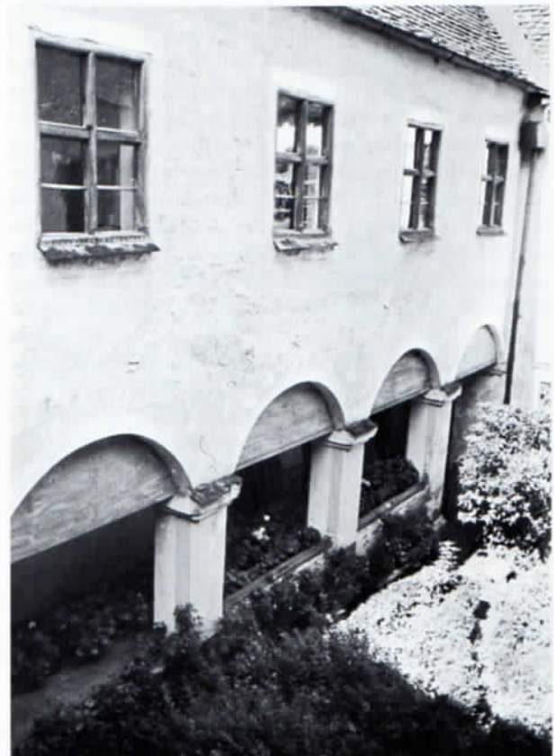
Der ehemalige Kreuzgang des Frauenklosters Altomünster vor der Restaurierung.

Zur Stiftung eines Klosters brauchte Altomünster nicht nur den geistlichen Arm des Bischofs oder des Papstes, sondern mehr noch den weltlichen des Landesfürsten. Das Original der Stiftungsurkunde ist verschollen, sie erhielt sich aber in vielen Abschriften. Sie regelte die wirtschaftliche Basis des neuen Birgittenklosters und die Stellung zum Landesherrn. Herzog Georg erklärte darin, im Kloster des Bischofs Alto ein Birgittenkloster, das Mariamünster heißen solle, stiften und dem Kloster Maihingen unterstellen zu wollen. Er befreite das neue Kloster von allen staatlichen Lasten wie Steuer, Kriegs-