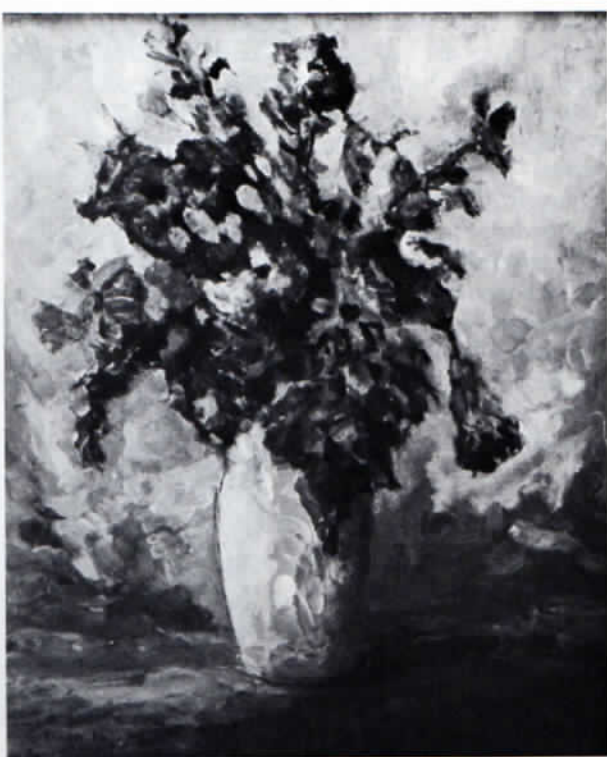
Georg Singer: Blumenstück, 1987, Öl/Holz, 60 x 50 cm.

Ausstellungsbeteiligung 1969 im Dachauer Schloßsaal, 1970 und 1972 in Münchner Galerien, 1979 Einzelaus-