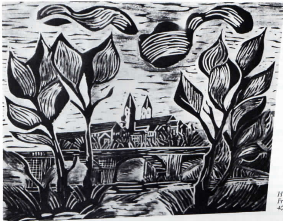
Heribert Meister: Domberg Freising, 1987, Linoldruck, 40 x 60 cm.

Gebäuden, im Diözesanmuseum Freising (»Künstler im Landkreis«), im Rahmen der Umweltwoche 1987 im Asam-Foyer Freising.