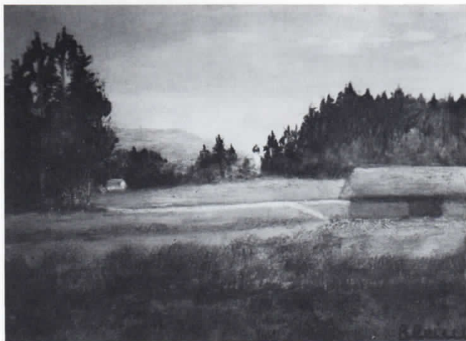
Ingrid Bleim: Landschaft im Erdinger Holzland, 1985, Öl/Lwd., 13 x 18 cm.

Ausstellungen: In Freisinger Banken und öffentlichen