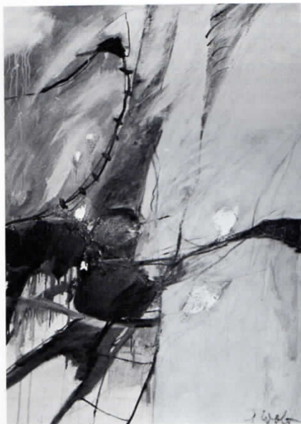
Anita Wolf: O. T., 1987, Öl/Lwd., 130 x 100 cm.

1975 1. Preis der Gemeinde Eching, 1978 Burda-Preis, 1986 Anerkennungspreis des Landkreises Freising für Malerei, Graphik und Pädagogik.