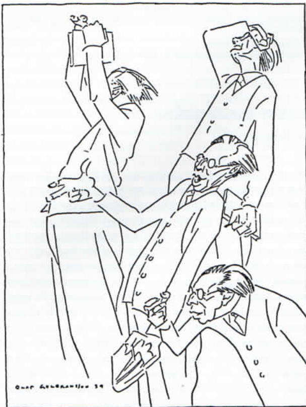
Olaf Gulbransson: Otto Falckenberg als Regisseur, Tuschzeichnung 1939.

Weihnachtsspiel« zu inszenieren, was sich als schicksalhafte Begebenheit, »als die Brücke zur eigentlichen Schaffensstätte seines Lebens« erweist. 1915 folgen unter Erich Ziegel weitere Inszenierungen in diesem Hause, dem er nun immer verbunden bleibt. Wie besessen stürzt er sich in die Arbeit als Regisseur, versteht es die Schauspieler mitzureißen. Schon 1917 hat er den Direktorposten der Münchner Kammerspiele inne. Er prägt diese Bühne in seiner ihm ureigensten Weise. Ab 1926 übernimmt er die Direktion des Schauspielhauses. Otto Falckenberg wird zum »Repräsentant einer modernen deutschen Bühnenkunst«.