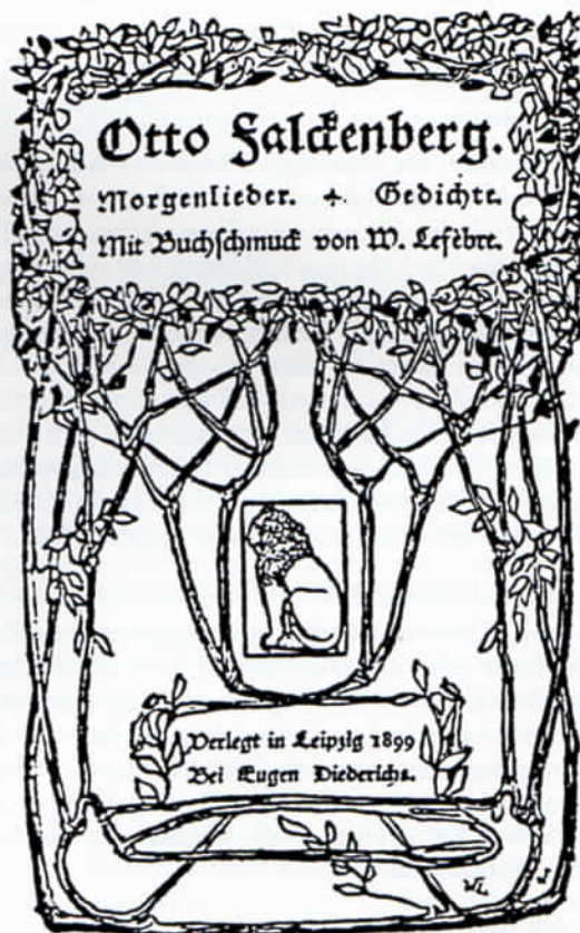
Titelblatt der Erstausgabe des Gedichtbandes von Otto Falckenberg »Morgenlieder«, 1899.

An der Stirnseite des sarkophagähnlichen Steins auf dem Grabe Otto Falckenbergs versinnbildlichen zwei reliefar-