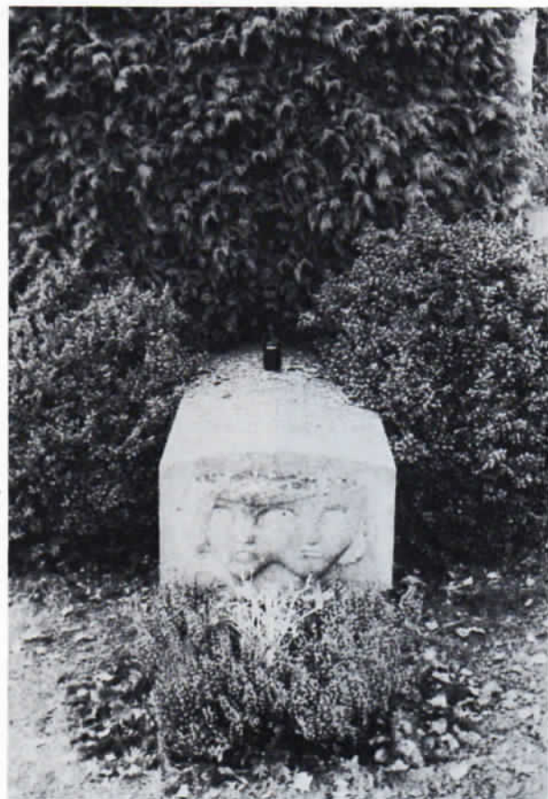
Ein sarkophagähnlicher Stein bedeckt das Grab von Otto Falckenberg auf dem Starnberger Friedhof.

Das väterliche Erbe ermöglicht es dem jungen Ehepaar sich 1905 ein eigenes Wohnhaus zu bauen. An der Bruker Straße (Nr. 44) in Emmering entsteht nach den Plänen von Architekt und »Scharfrichter-Kollegen« Max Langheinrich ein Haus »im modernsten, elegantem englischen Landhausstil«. An seiner Nordseite grenzt das romantisch gelegene Grundstück direkt an das Ufer der Amper. Gegenüber liegt das reizvolle »Emmeringer