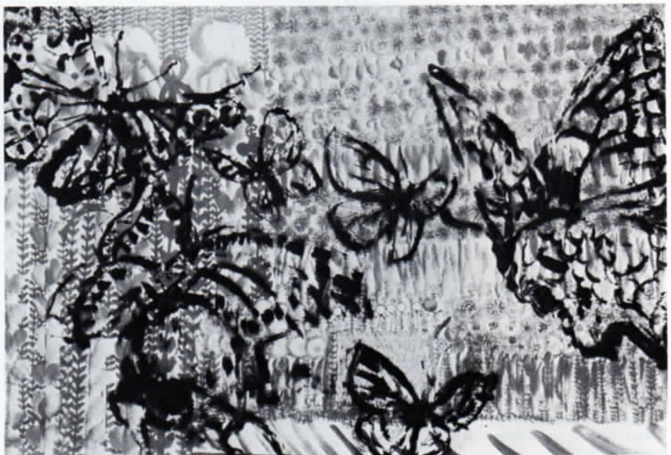
Vera Waske: Schmetterlinge, Collage, 1987, 21 x 30 cm.

1978 Diplomvorbereitungen. Leider wird die Diplomarbeit aus politischen Gründen nicht angenommen. Sie wandert durch sämtliche Instanzen, aber der oberste Verwaltungsentscheid heißt »njct«.