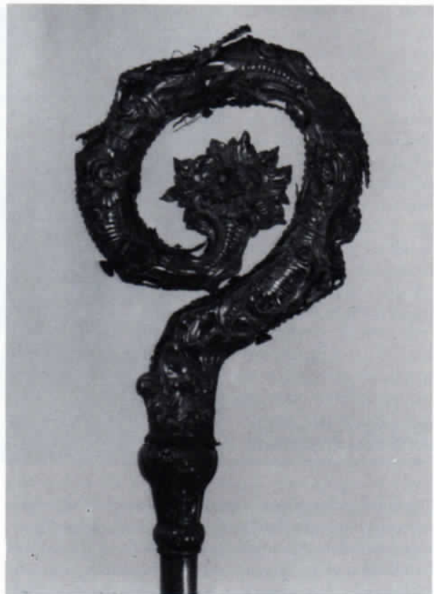
Der Propststab von Indersdorf.