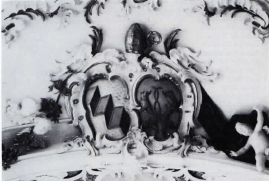
Wappen des Klosters Indersdorf im Chorbogen der Klosterkirche.

Digitus und Bugia (Assistent des Zelebranten, der Priester war), einen Diakon und Subdiakon, je einen Capellanus für Mitra, Stab und Buch, zwei Ministranten mit Rauchfaß und Schiffchen, zwei mit Leuchtern und acht Fackelträger. Insgesamt also 16 Personen, die einen liturgischen Dienst ausüben.