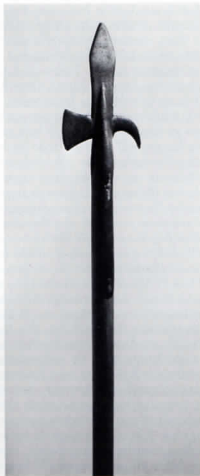
Die Hellebarde der Dachauer Nachtwächter.