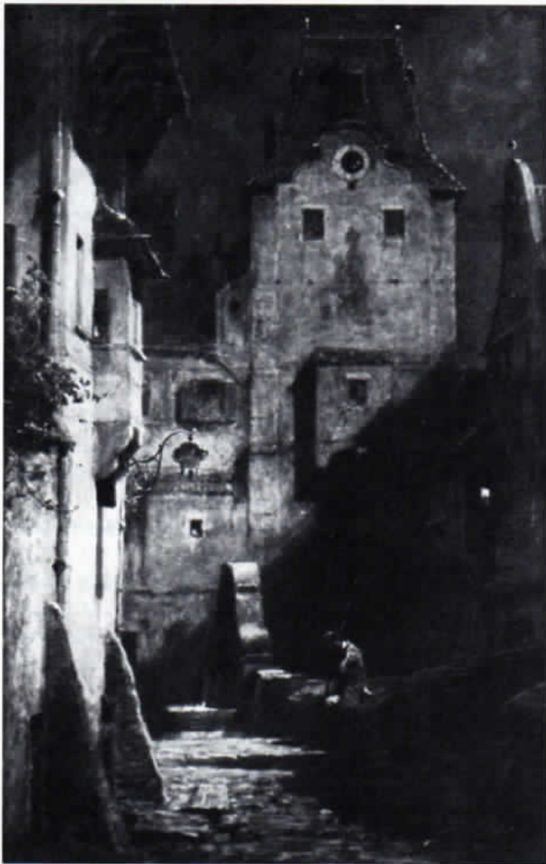
Carl Spitzweg: Der eingeschlafene Nachtwächter . Öl auf Holz, 29 x 18,8 cm, um 1875. Der Nachtwächter trägt hier einen langen Rock.