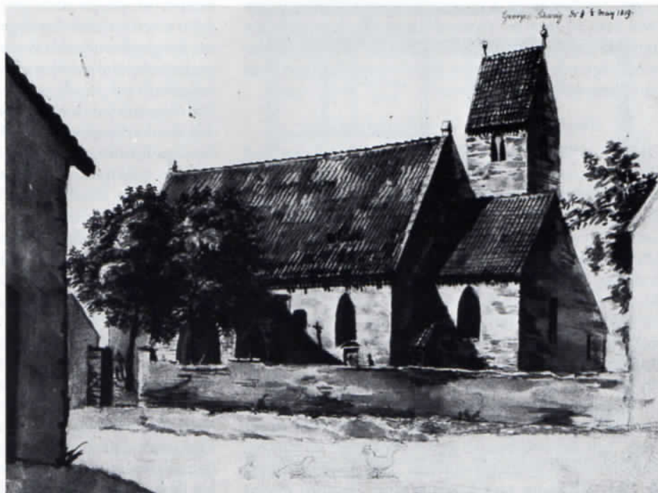
Die alte St.-Georgs-Kirche in der Georgenschwaige nach einer Zeichnung vom 8. Mai 1819. Aus dem Nachlaß von Prof. Theodor Dombart.

moching, Freimann, Schwabing, Neuhausen und Moosach. Zu diesem Zeitpunkt gehörten die genannten Orte mit der Niedergerichtsbarkeit zum Amt Neuhausen des alten Landgerichtes Dachau. Die kurfürstliche Schwaige in Milbertshofen unterstand dem Hofmarksrecht und war für die Richter in Dachau exempt. Ein im Landgericht Dachau gelegenes zweites Milbertshofen, 1760 ein Weiler, aus fünf Anwesen bestehend und zur Haupt-