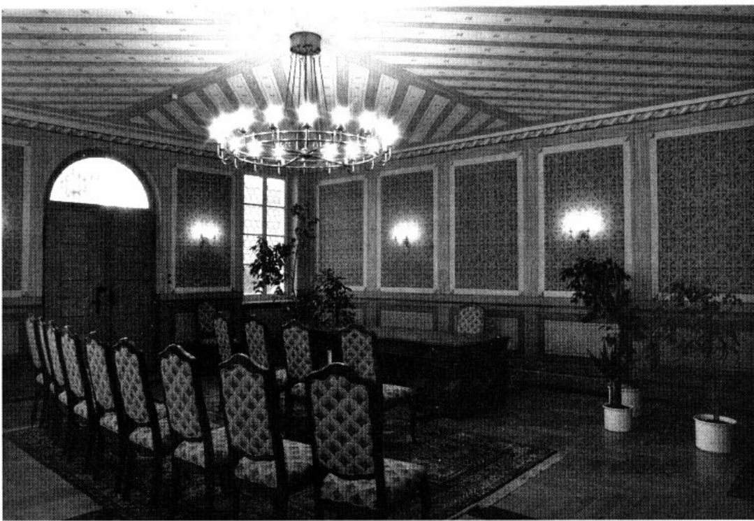
Der Versammlungssaal im Alten Rathaus Fürstfeldbruck heute mit rekonstruierter Dekorationsmalerei von 1908.