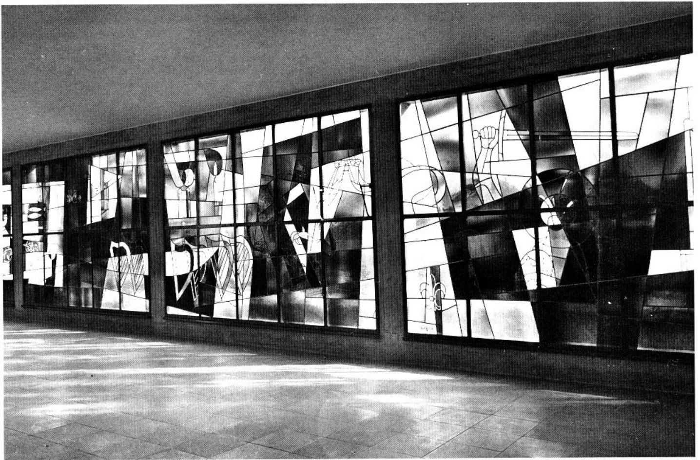
St. Cäcilia, Neugermring. Glasgemälde von Josef Dering.