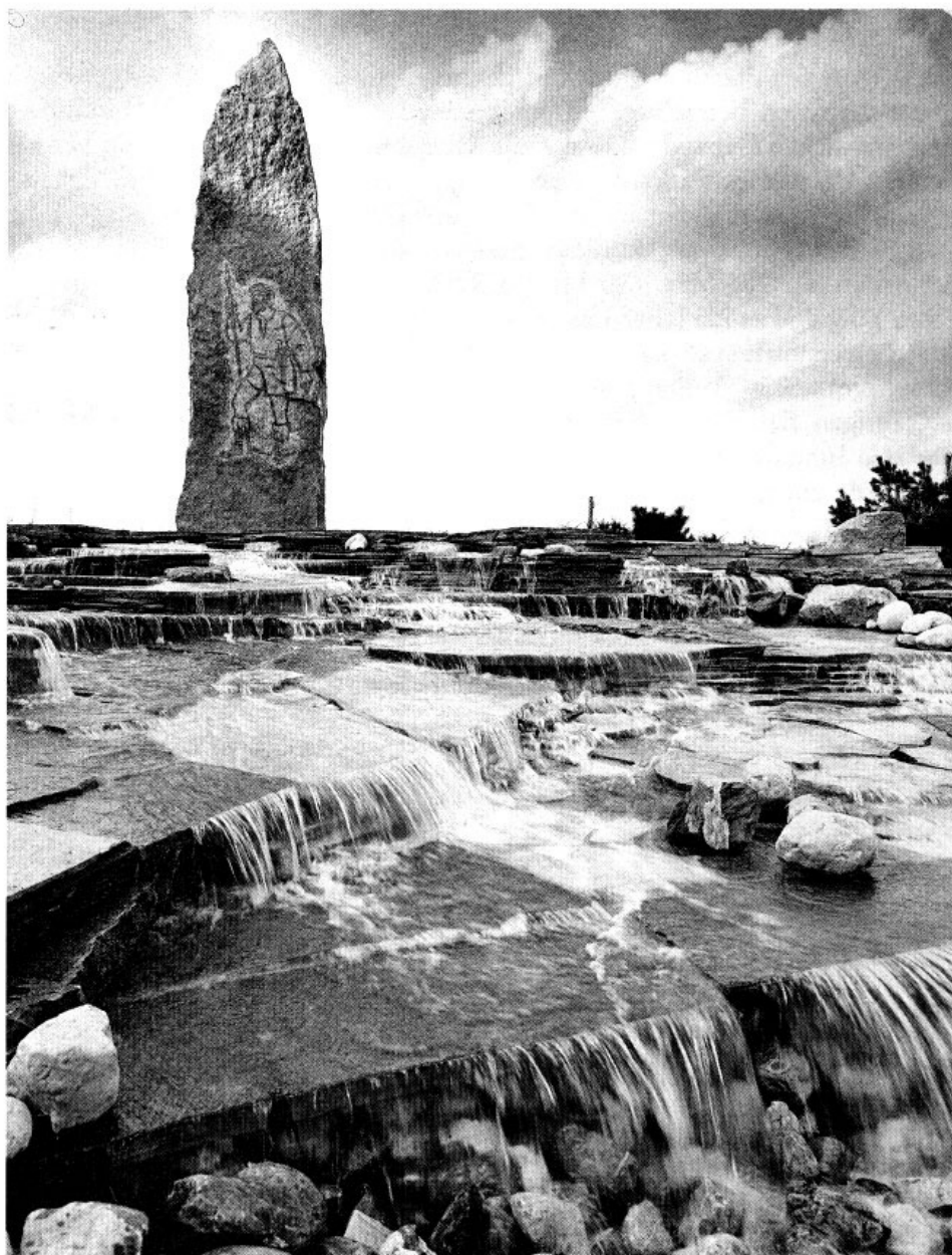
Germering, Gernar-Brunnen von Josef Dering.

Im Germeringer Ortsteil Unterpfaffenhofen sind in der katholischen Pfarrkirche St. Johannes Bosco von 1956 Glasbilder Derings, zusammengesetzt aus kräftigen Farbscheiben, zu sehen: Symbole der Eucharistie, des Jüngsten Gerichts und der Heiligsten Dreifaltigkeit. Das ebenfalls diesem italienischen Heiligen geweihte Caritas-Altenheim empfängt den Besucher mit einer Hinweistafel aus Keramik und über dem Eingang mit einem