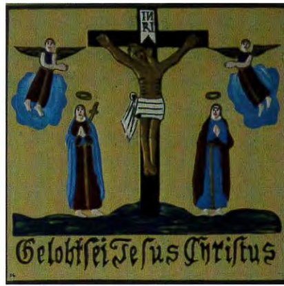
Haustafeln in Vierkirchen (Bertold)