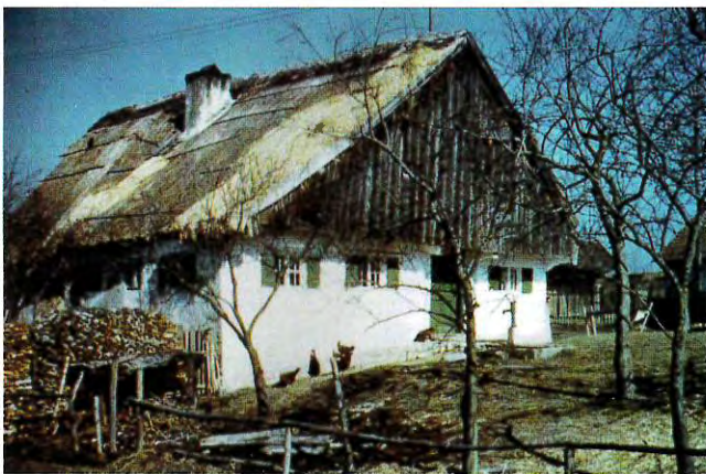
Typisches Kleinbauern- und Handwerkerhaus, das »Schusterhäusl« in Pasenbach, um 1964