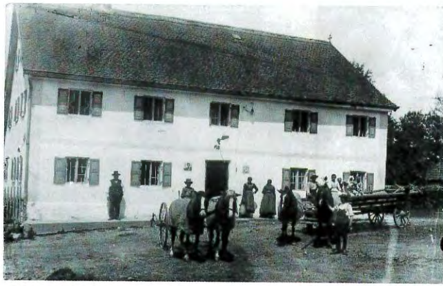
»Reischlhof« (Mayr) in Vierkirchen, um 1920