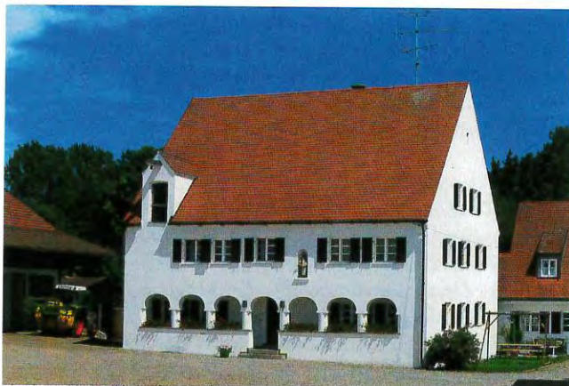
Das »zweigadige« Wohnhaus »Kuttendreiers« in Westerdorf mit überdachter »Gred«, aber ohne Haustafel.