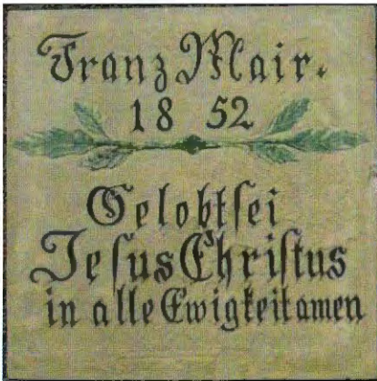
Frau Anni Brosche, geborene Burkhard, hat zwei Platten, die sich ehemals beim »Feierabend« in Rettenbach (Bild rechts) befanden, der Gemeinde Vierkirchen überlassen. Sie werden im Archiv aufbewahrt und sollen zu einem späteren Zeitpunkt fachmännisch restauriert und ausgestellt werden.