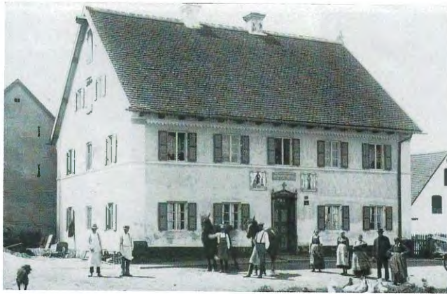
Wiedenzhausen 20, »Kramer, Salzera« – mit zwei großen Haustafeln