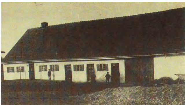
Einfirstanwesen »Reindlhof« in Vierkirchen, um 1900